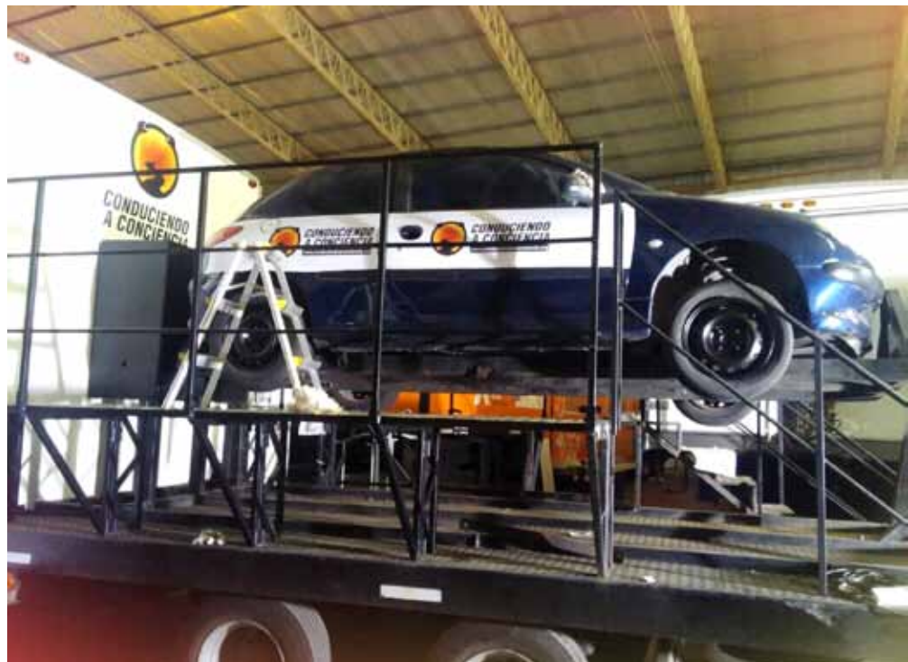
Simulador de vuelco en el 7º Salón del Automóvil en Buenos Aires.